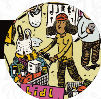
Emma besorgt nach der Arbeit im Büro den Einkauf für die Woche. Sie ist froh, dass sie heute allein unterwegs ist. So kann sie sich ein paar Produkte genauer angucken, ohne dass die Kinder sie quengelnd zum Süßigkeitenregal ziehen.

Und wenn wir doch etwas Nachhaltiges einkaufen wollen, greifen wir zu Produkten mit „fairen“- oder Bio-Siegeln, von denen es mittlerweile eine unüberschaubare Vielzahl gibt (Ebene 3). Aber welche Siegel stehen für ernstzunehmende soziale und ökologische Produktion? Und wann handelt es sich lediglich um Feigenblätter, die das Image der Unternehmen verbessern sollen? Es ist gar nicht so einfach sich im Labellabyrinth zurecht zu finden. Und geht es nur um „besseren“ Konsum oder müssen sich nicht die Bedingungen in den Produktionsketten grundsätzlich verändern?