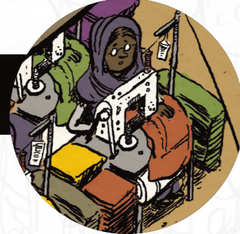
Elif arbeitet seit mehr als 10 Jahren als Näherin in der Türkei. Sie muss ständig Überstunden machen und arbeitet auch am Wochenende, weil der Lohn so niedrig ist.

Die Gründung von Gewerkschaften und die Forderung nach Verbesserungen der Arbeitsbedingungen sind mit hohem Risiko verbunden. Streiks werden oft gewaltsam unterdrückt (Ebene 3). Es gibt aber mutige Arbeiter*innen, die mit Unterstützung internationaler Partnerschaften und unter hohem Risiko für Verbesserungen der Arbeitsbedingungen kämpfen.