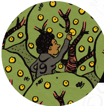
Juan pflückt zwei Tonnen Orangen pro Tag für umgerechnet 10 Euro. Er arbeitet in der fünften Saison auf einer Orangenplantage in Südbrasilien und hat weder eine Krankenversicherung noch einen Arbeitsvertrag.