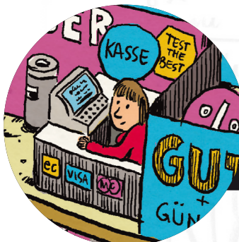
Maria arbeitet seit 15 Jahren im Supermarkt. Sie hat nur einen Teilzeitvertrag. Für 450 Euro steht sie ständig auf Abruf bereit, um an der Kasse einzuspringen.