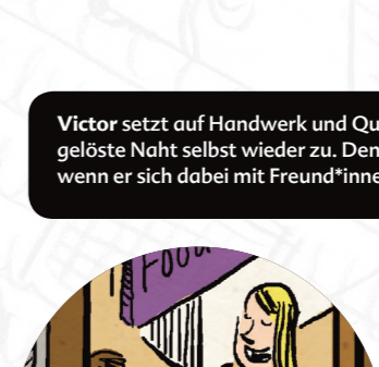
Anna und Laura können kaum glauben, wie viele leckere und gute Lebensmittel sie heute aus dem Foodsharing Regal mitnehmen können. Sie werden einen großen Eintopf kochen und Freunde einladen.

All diese lebendigen Initiativen sind Alternativen. Mit ihnen können wir im Kleinen die gewinnorientierte und an vielen Stellen ausbeutende Wirtschaft umgehen.