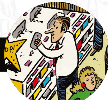
Oscar hat wieder ein Schnäppchen gekauft. Nun hat er ein neues Smartphone, obwohl er schon letzten Monat eins gekauft hat. Aber bei dem Preis musste er einfach zuschlagen.