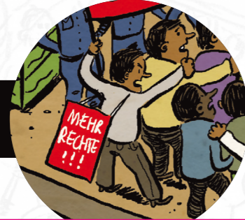
Sokhan arbeitet seit acht Jahren als Näher in Kambodscha. Er hat versucht, eine Gewerkschaft zu gründen, um die Missstände in der Fabrik zu bekämpfen und hat deshalb seinen Job verloren.